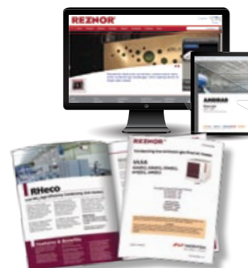
Exemples de la documentation devant être fournie

Toutefois, les documents relatifs au produit ainsi que les sites Web du fabricant, doivent mentionner l'efficacité énergétique saisonnière et les émissions de NO x de chaque produit ou système.