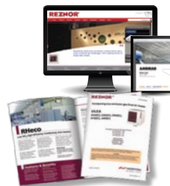
Voorbeeld van de documentatie die moet geleverd worden

Productdocumentatie en de websites van de producenten moeten echter de seizoensgebonden efficiëntie en de NO x -uitstoot van elk product of systeem vermelden.